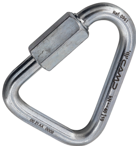
Delta Quick Link Steel 0961 Ø 10 mm

Maglie rapide triangolari, specifiche per la connessione a componenti in fettuccia. Particolarmente adatte all'installazione del bloccante ventrale sulle imbracature per accesso su corda.