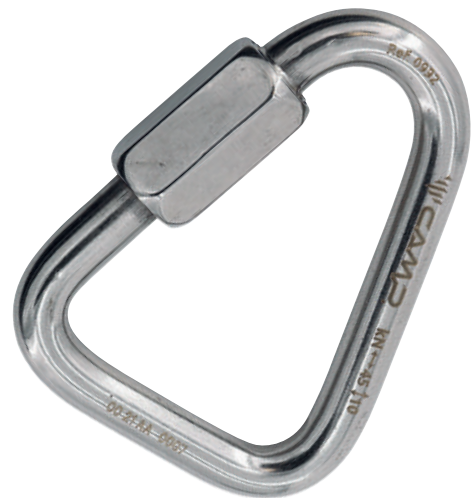
Delta Quick Link Stainless 0992 Ø 10 mm

In acciaio inossidabile, per installazioni esterne o in ambienti corrosivi.